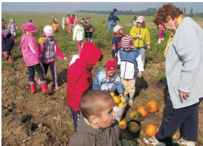
A kerti földeken jártunk