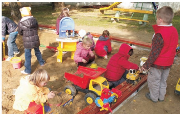
Felújították a homokozót