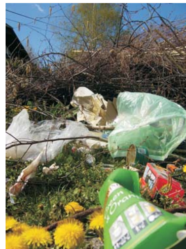
/ Helyszín: Rákóczi utca 253 környéke/

Ez a magatartás nemcsak közösségtelen, az illető igénytelenségét mutatja, elriasztja a vendéget, hanem súlyosan károsítja a természeti környezetet, a nádas szennyezése a víz öntisztuló képességét is rontja. Káros, a vízpart biológiai egyensúlyát megbontja.