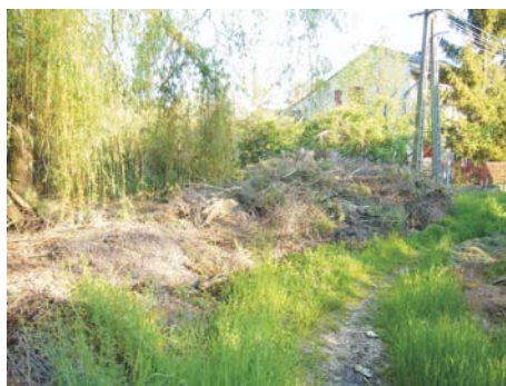
/ Helyszín: Kígyó utca vége /

De végigjárva a sok kis vízre vezető utcát, elkéserítő állapotokat is találtunk. A szép, ápolat portákról az oda -nem valónak ítélt szemét a közterületekre kerül! Az ott élők elmondják, hogy egyes nemtörődöm tulajdonost nem lehet jobb belátásra bírni! A levágott ágakat, szemetet, fűnyesedéket a nádas szélébe hordják, megkeserítve a szomszédság életét. A levágott zöld pedig ott korhad, büzlik, ki tudja mióta, meleg-ágya a sok szűnyognak.