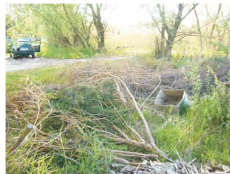
/ Helyszín: Honvéd - Parti utca környéke/

Arról nem is beszélve, hogy a környezetvédelmi rendelet értelmében szabálysértést követ el a személtelő, ami keményen büntethető!