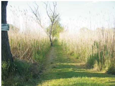
/ Helyszín: Fenyőfa utca környéke /

Az emberek összefognak, a munkát felosztják és gondozott, rendezett a part, a maga természetes állapotában.