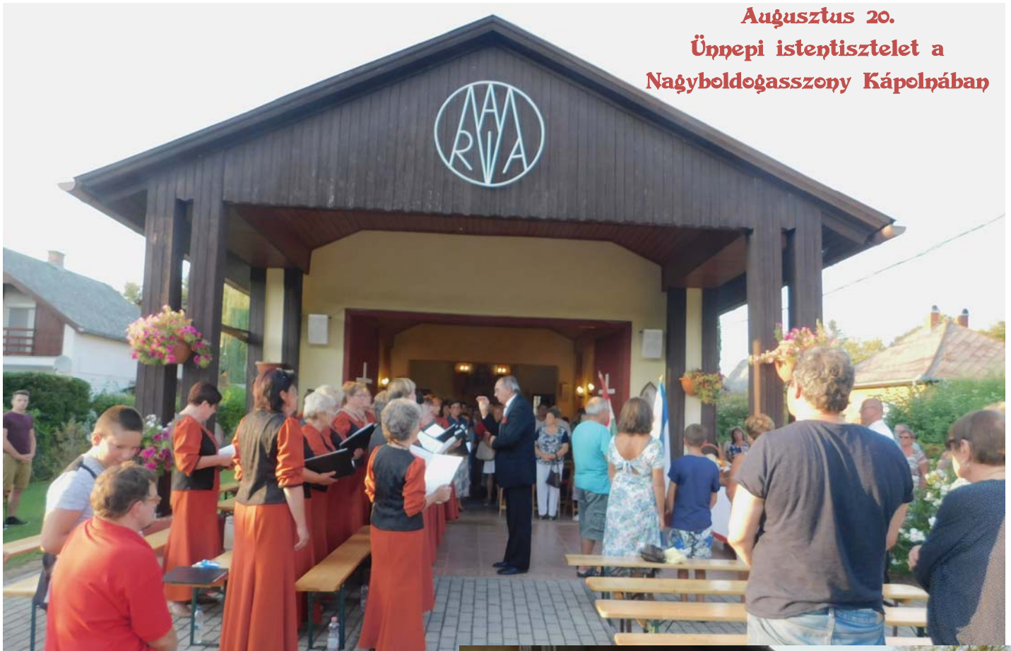
Augusztus 20. Ünnepi istentisztelet a Nagyboldogasszony Kápolnában

Balatonmárfürdő Község Önkormányzatának havonta megjelenő kiadványa